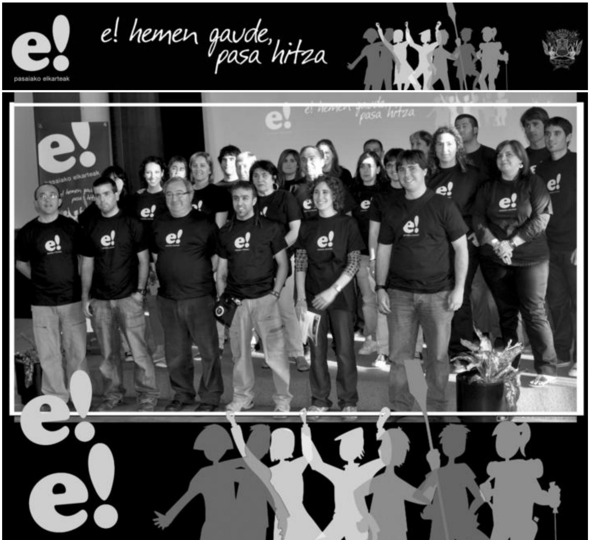
Irudian, egitasmoarekin bat egin duten elkarteetako eta eragileetako kideak, eta Pasaia Udaleko ordezkariak, joan den astean Trintxerpen egin zuten agerraldian. OARSOALDEKO HITZA